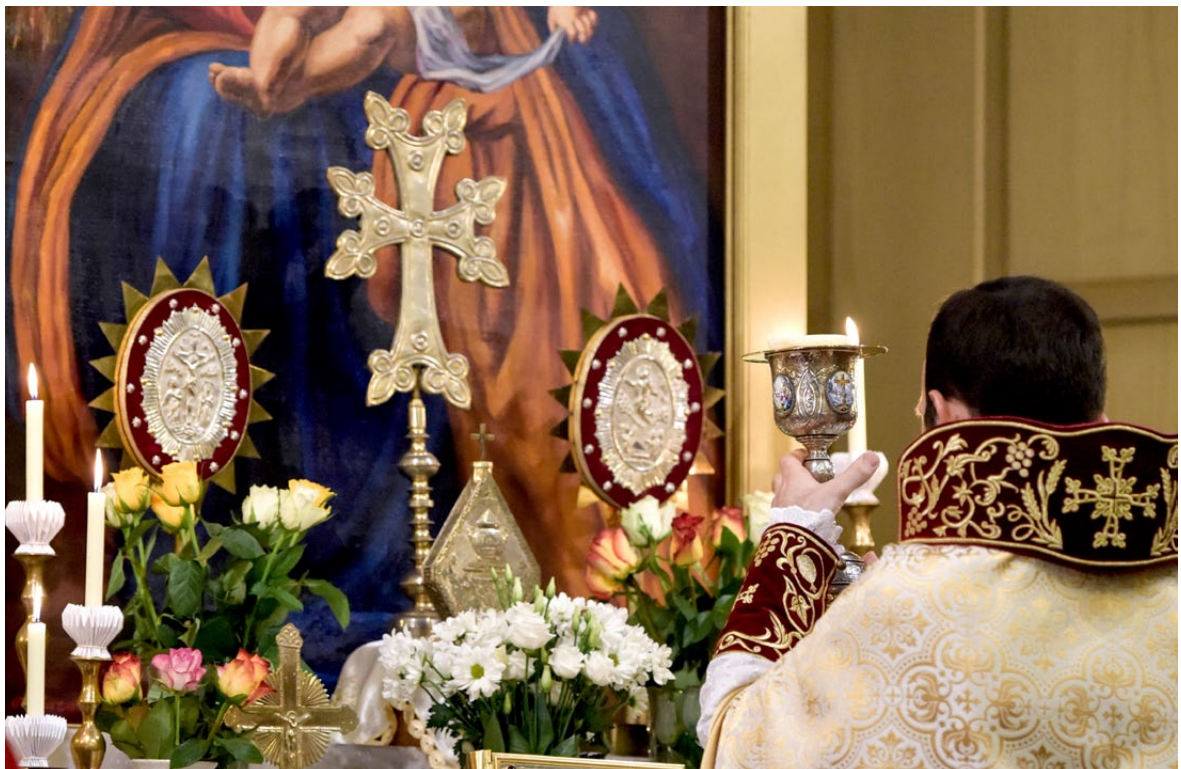
Heilige Liturgie der Armenisch-Apostolischen Orthodoxen Kirche