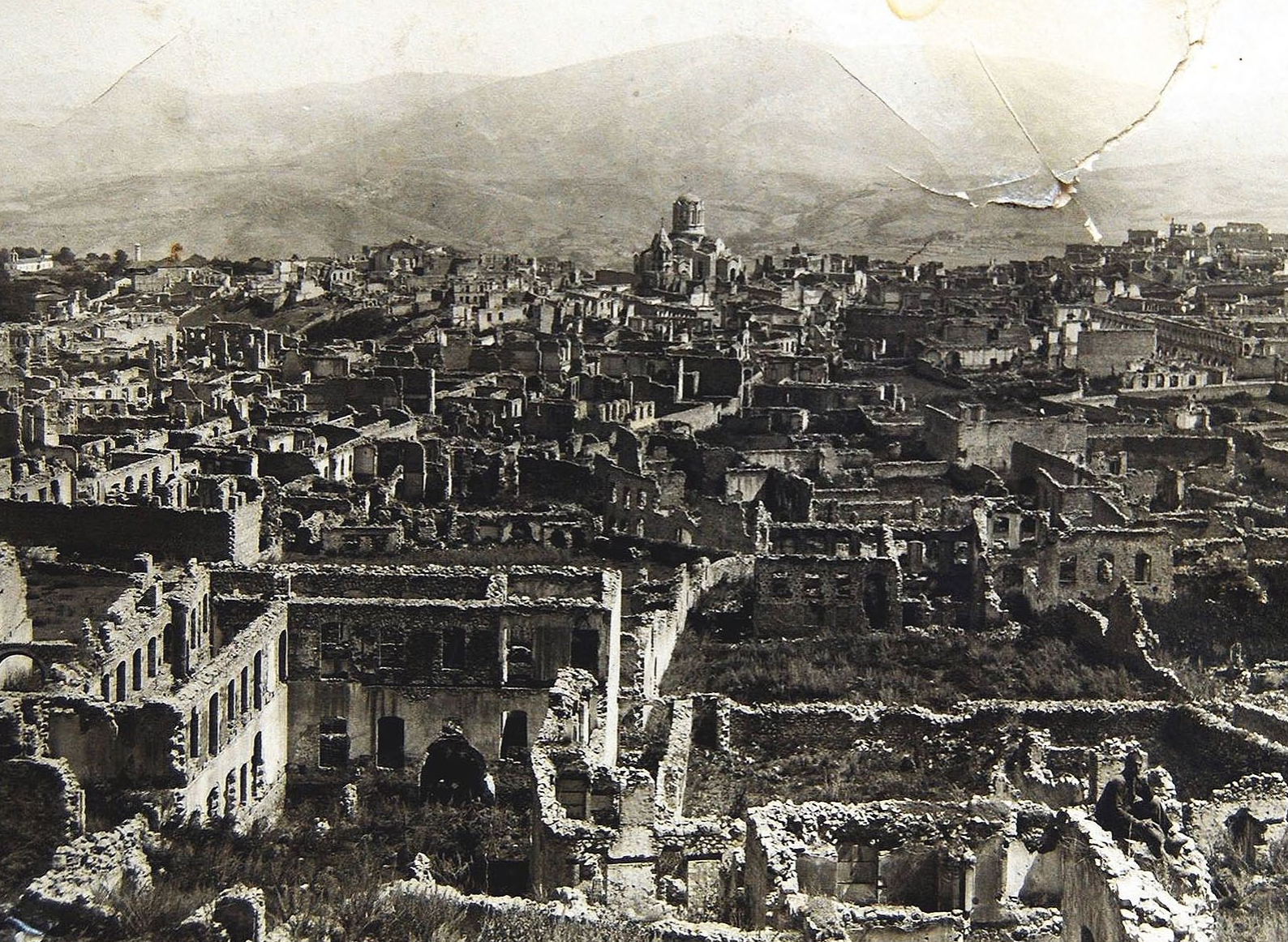
Während des Armenisch-Aserbaidschanischen Krieges verübten aserbaidtschanische Truppen ein Massaker an der armenischen Bevölkerung in Schuscha, der damals größten Stadt Bergkarabachs. Das Bild zeigt die Ruinen des vollständig zerstörten Armenierviertels von Schuscha nach dem Pogrom im März 1920