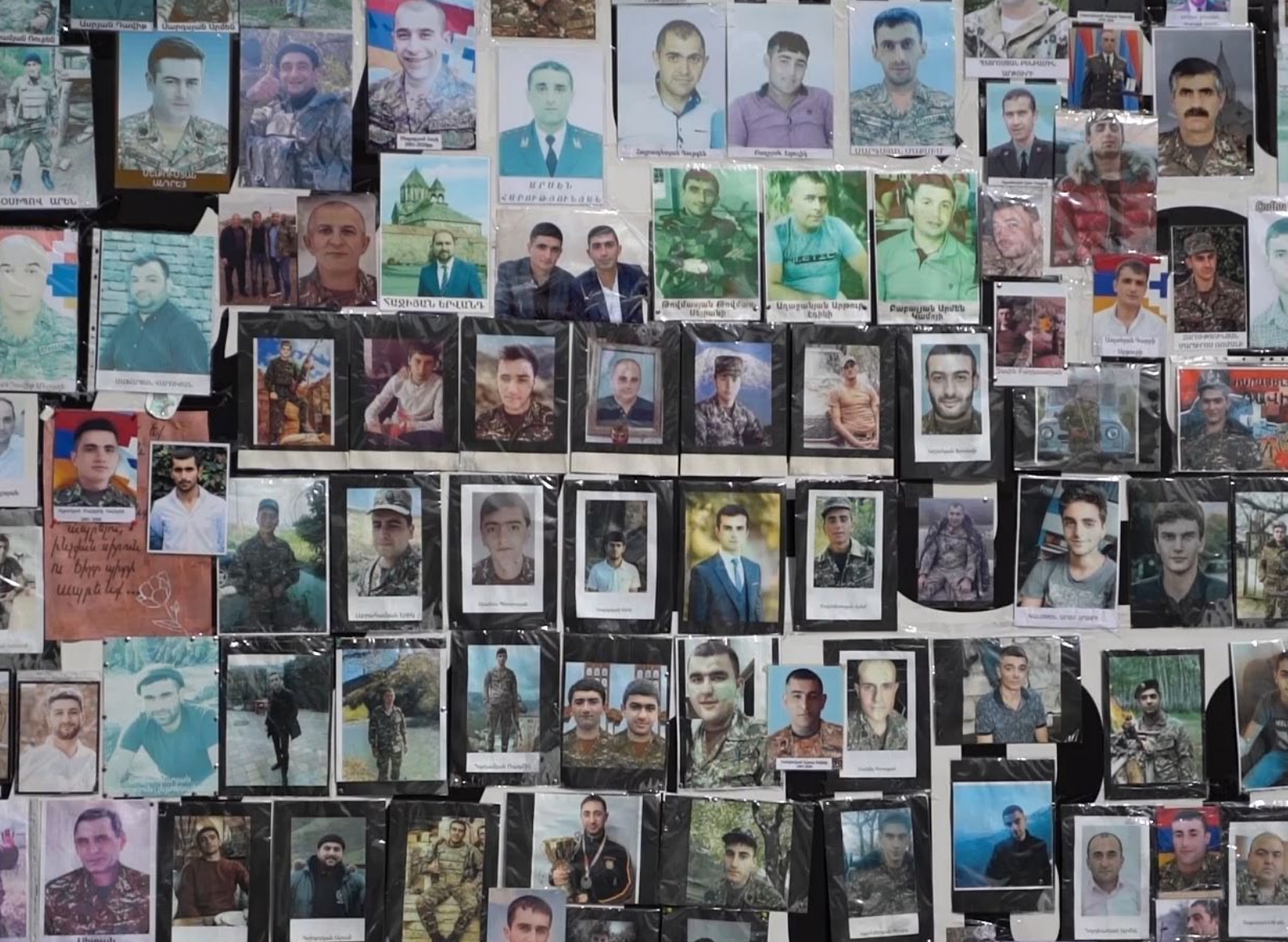
An einer Wand in Jerewan angebrachte Fotos armenischer Soldaten, die im Krieg um Bergkarabach 2020 getötet wurden (Juni 2021)

Dies erlaubte es Baku, im Schatten von Russlands Krieg gegen die Ukraine im September 2023 den letzten Schlag zu führen. Während in New York die UNO-Vollversammlung tagte, griff die aserbaidchanische Armee die Republik Arzach an. Nach nur einem Tag mussten die Behörden des De-facto-Staats die Kapitulation erklären. Augenblicklich öffnete Aserbaidschan den zuvor neun Monate geschlossen gehaltenen Korridor und das Erwartbare trat ein: Die gesamte Bevölkerung Karabachs, über 100.000 von der Blockade ausgezehrt, durch jahrelange Drohungen verängstigte Menschen flohen in wenigen Tagen aus ihrer Heimat.