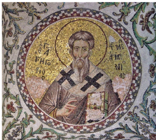
Gregor der Erleuchter. Mosaik aus dem 14. Jahrhundert in der byzantinischen Pammakaristos-Kirche in Konstantinopel, der heutigen Fethiye-Moschee in Istanbul