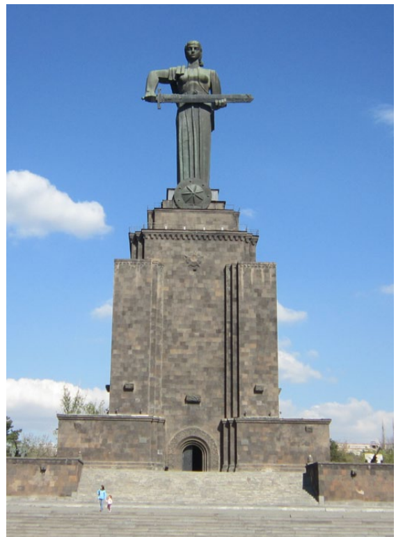
Monument Mutter Armenien an derselben Stelle, seit 1967