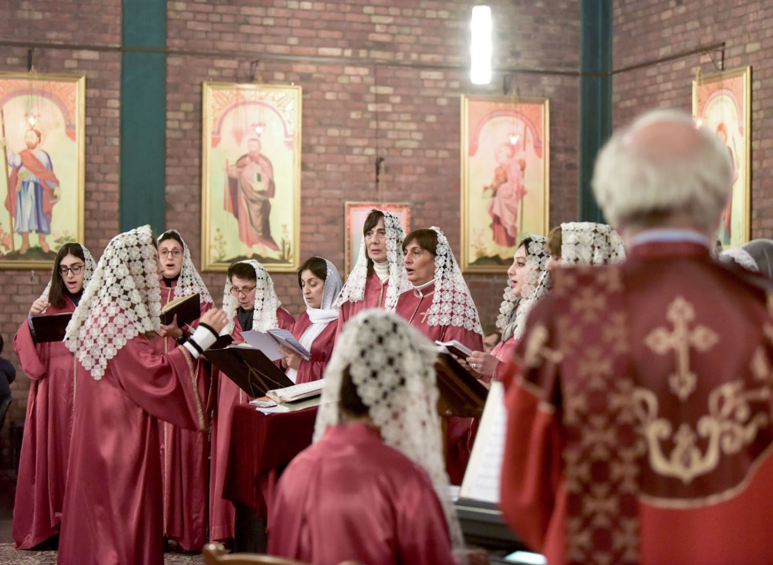
Komitas-Chor der Armenischen Gemeinde Köln