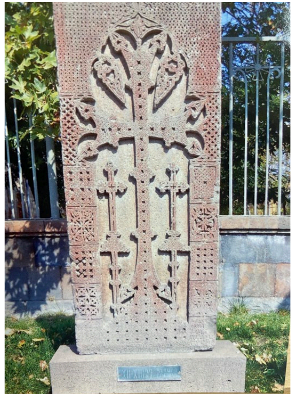
Kreuzsteine aus dem 9. Jahrhundert (links) und 12./13. Jahrhundert (rechts) in Etschmiadsin