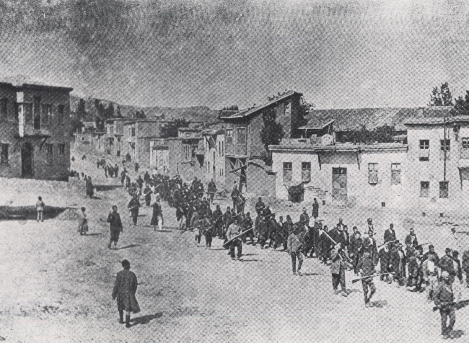
Osmanische Soldaten bringen armenische Männer aus Kharput zur Exekution (April–Juni 1915)