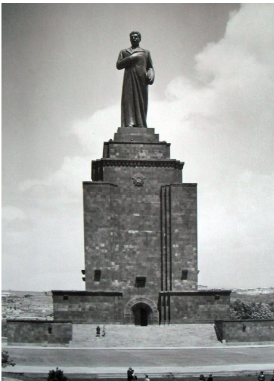
Stalin-Statue in Jerewan, 1950 bis 1964

Ab Ende der 1950er Jahre brachte die unter Stalin Anfang 1930 mit brutalen Methoden eingeleitete