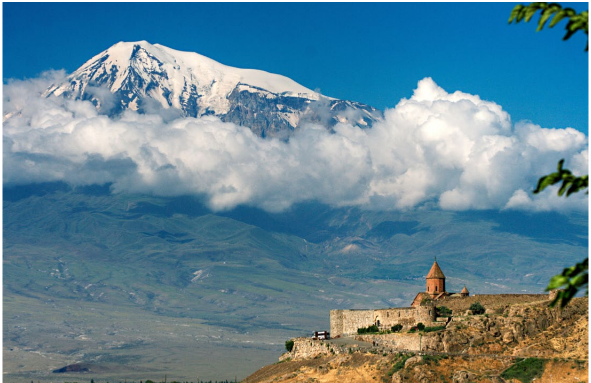
Kloster Chor Wirap, dahinter der Berg Ararat