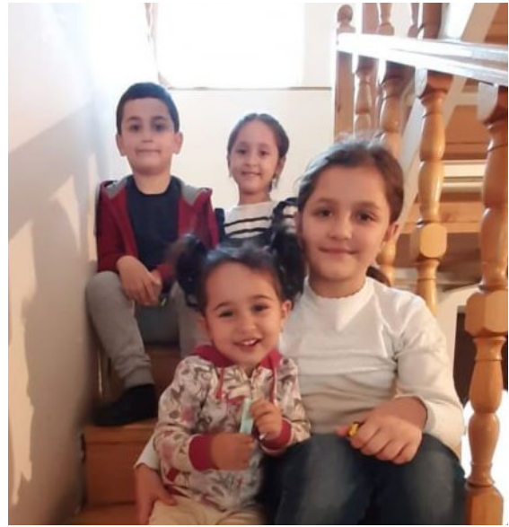
Kinder im Regenbogenhaus

Im zweiten Stock des Hauses lebt, bedingt durch den Krieg 2020 in Bergkarabach, Familie Martirosyan. Im Krieg haben sie alles verloren. Seit der Flucht leidet die älteste Tochter unter Ängsten. Sie ist in psychologischer Behandlung.