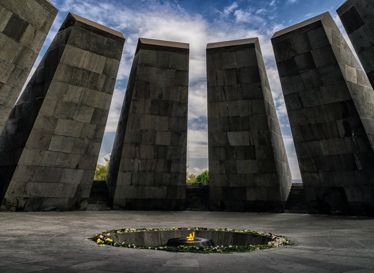
Das Mahnmal für den Völkermord an den Armeniern in der Hauptstadt Jerewan