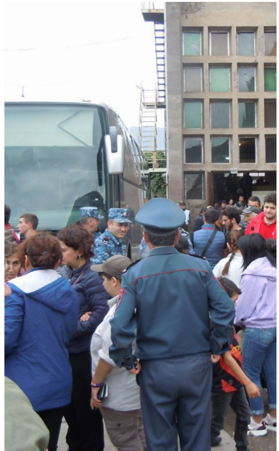
Flüchtlinge aus Bergkarabach treffen in Goris ein