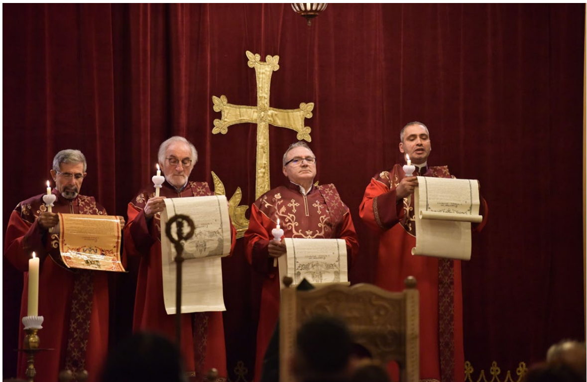
Messe zum Heiligabend