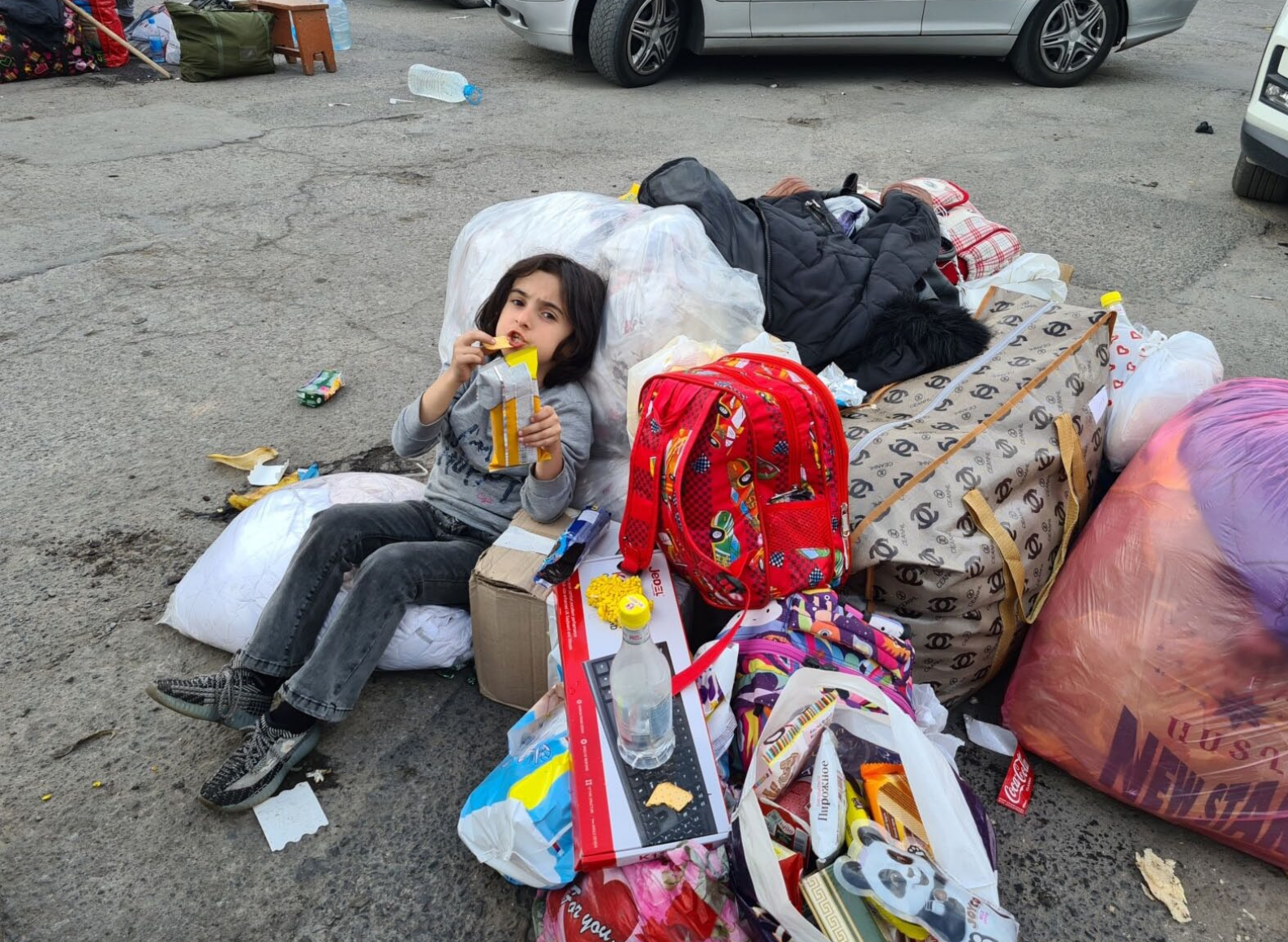
Ein Mädchen nach der Flucht aus Bergkarabach im Grenzort Goris, 29. September 2023