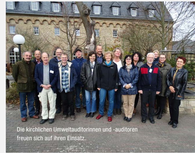
Die kirchlichen Umweltauditorinnen und -auditoren freuen sich auf ihren Einsatz.